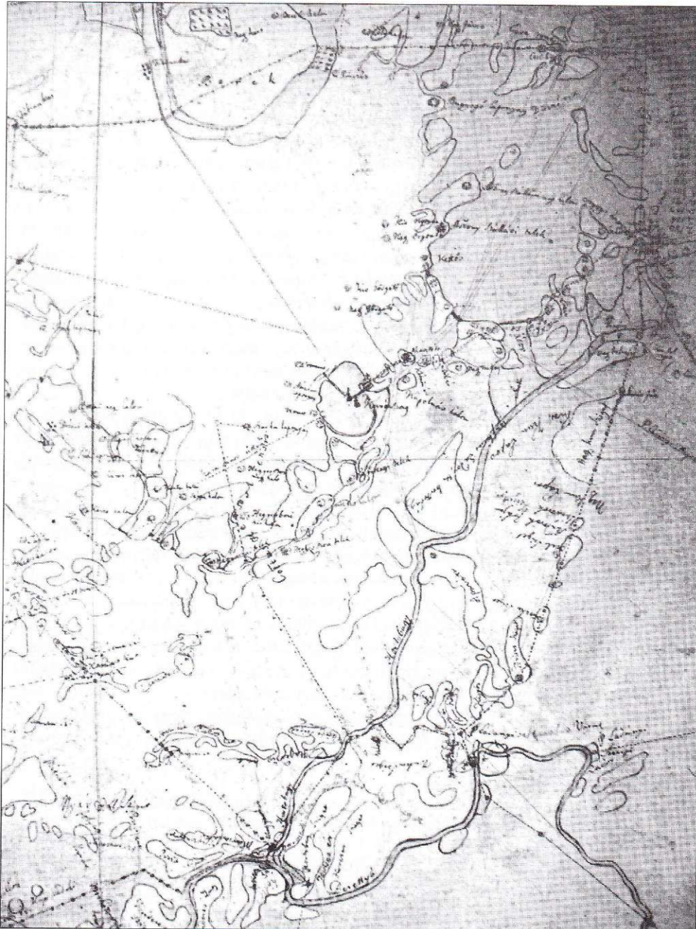
2. sz. kép A karcagi határ árvizes és vízmentes területei (JNSZML Térképtár T 76 - 1784)